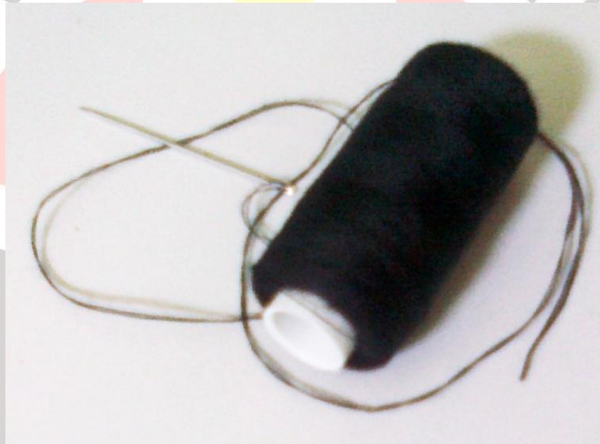
Gambar 3.5 Benang dan jarum jahit