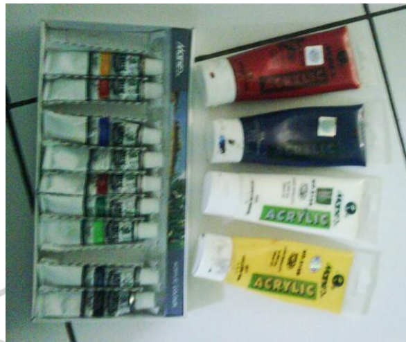
Gambar 3.1 Cat akrilik