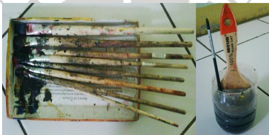
Gambar 3.3 kuas berbagai ukuran