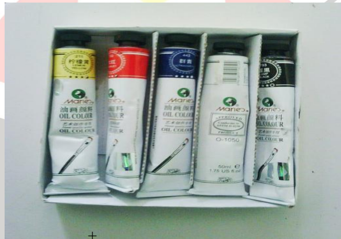
Gambar 3.2 Cat minyak