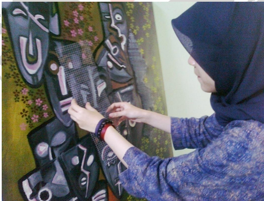
Gambar 3.8 Proses pemasangan ram kawat