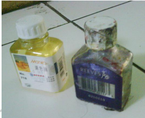
Gambar 3.4 Minyak (Maries)