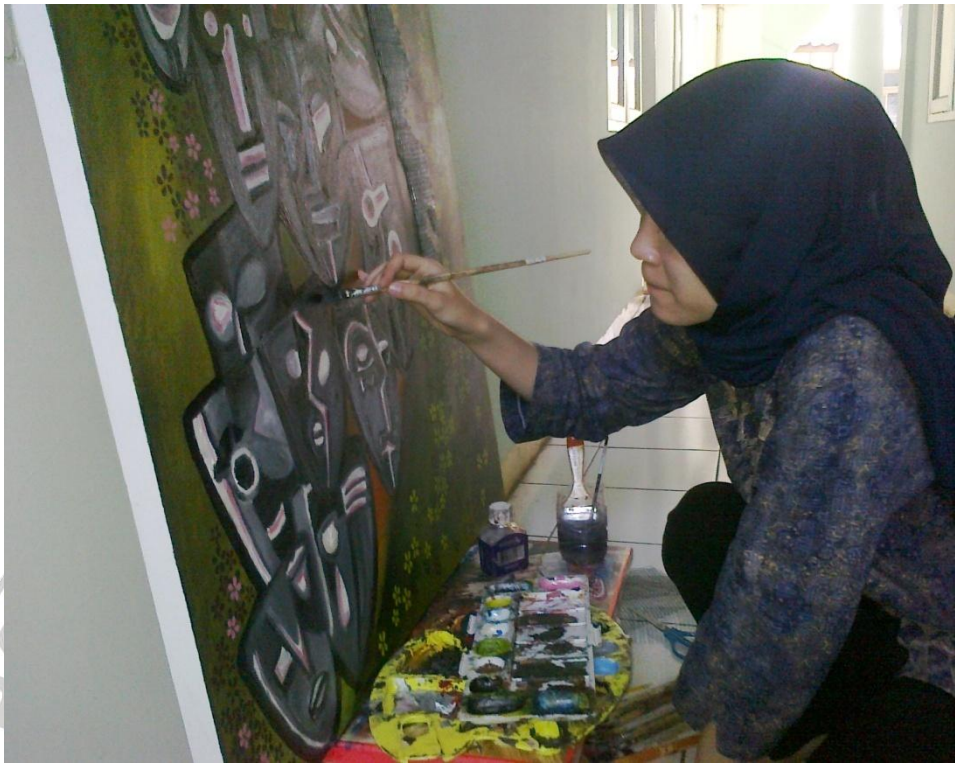
Gambar 3.7 Proses berkarya lukis